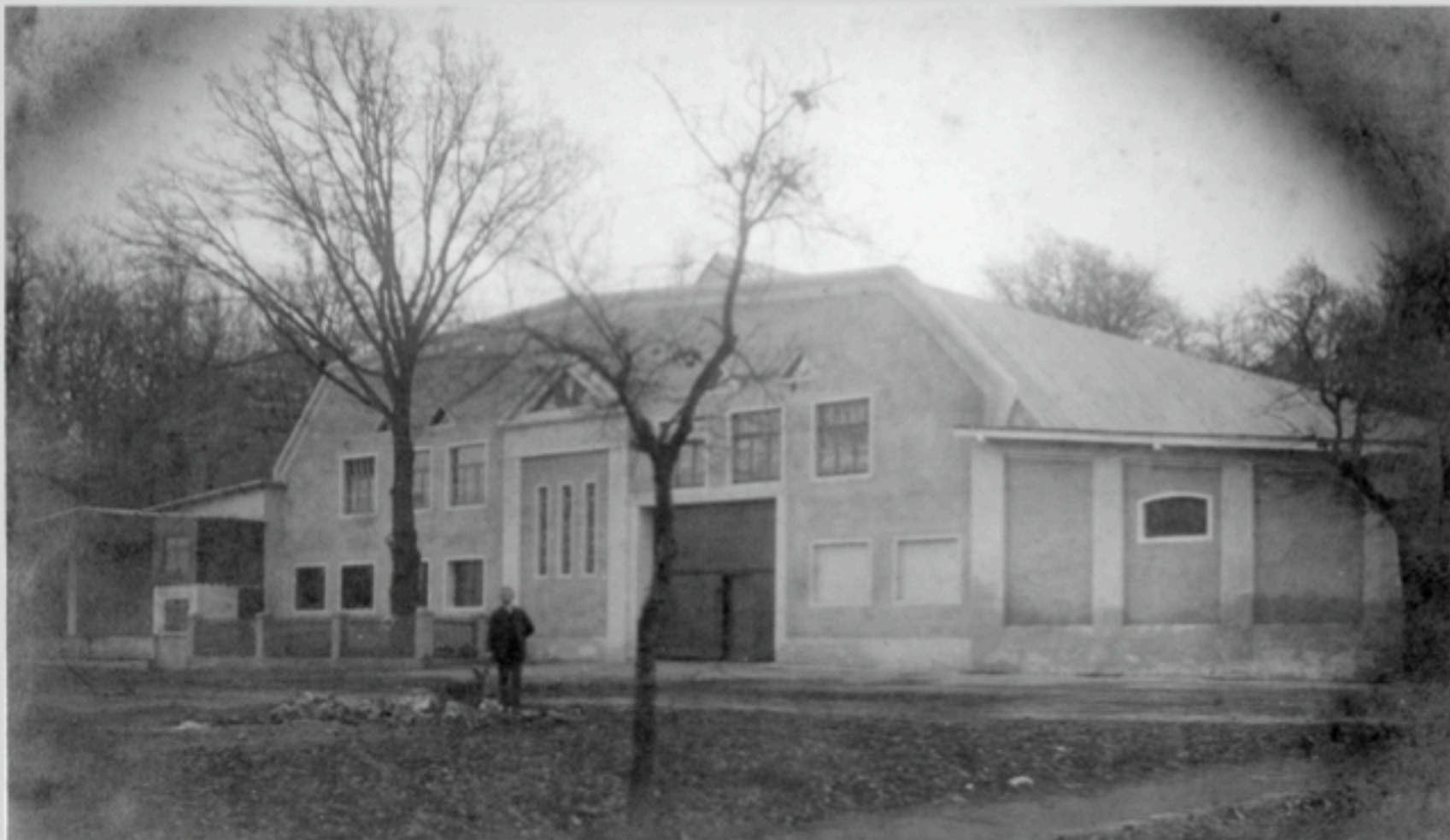
- Mineralwasserfabrik Bad Neu-Ragoczy anno 1917 -